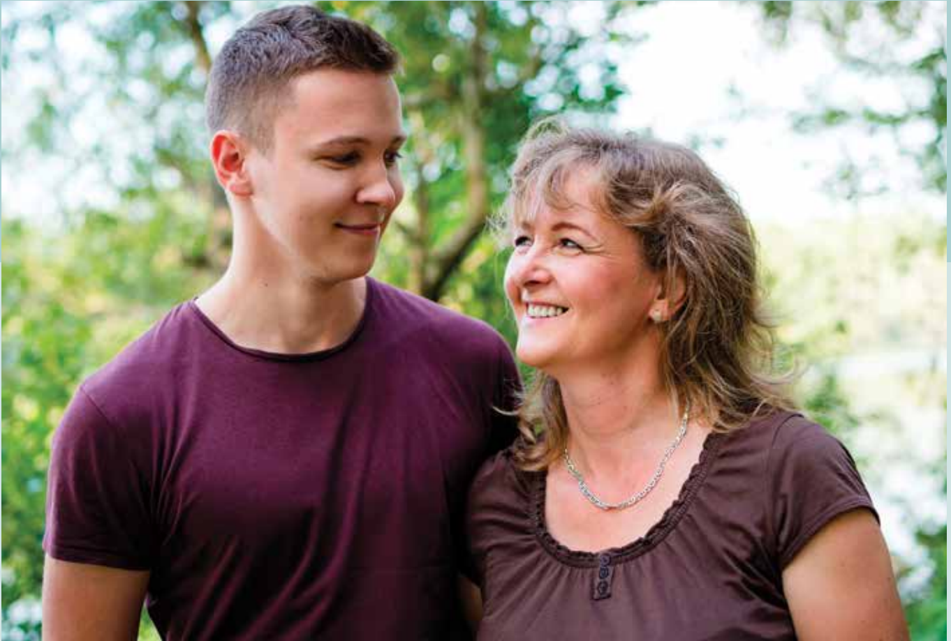
Een ouder die begeleidt doet dat als ouder en niet als professional.

De Raad kijkt dan wat er in de Memorie van Toelichting over is geschreven: