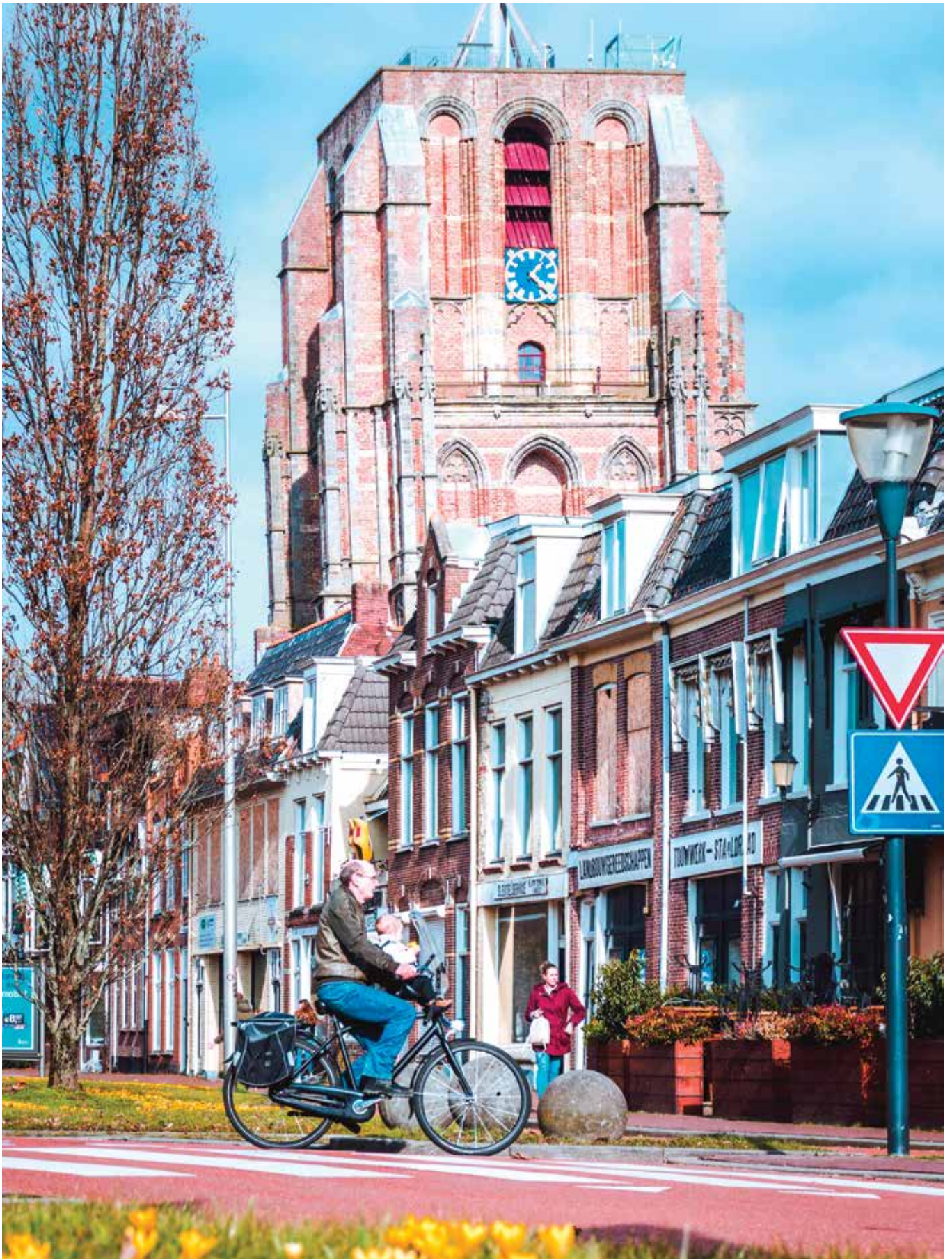
Leeuwarden, maart 2021