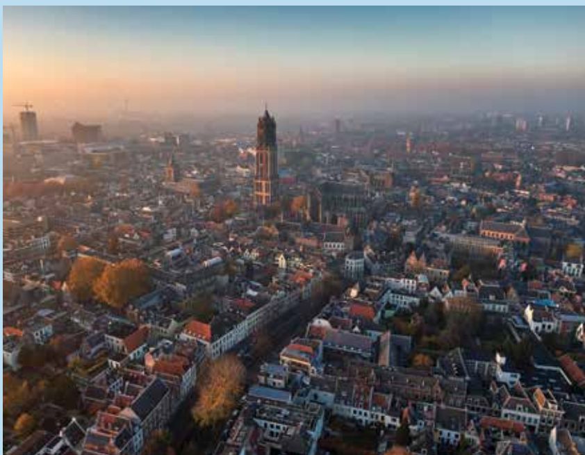
Utrecht vanuit de lucht.

Voor Utrechtse inwoners die gebruik maken van hulp bij het huishouden en voor wie deze ondersteuning na 2021 ook belangrijk is, zijn afspraken gemaakt over de continuïteit in de ondersteuning. Uitgangspunt is dat cliënten hetzelfde aantal uren hulp in het huishouden blijven ontvangen en zoveel mogelijk hun eigen vertrouwde hulp behouden. De vier aanbieders zetten zich ook maximaal in om medewerkers van de partijen die afscheid nemen over te nemen met behoud van arbeidsvoorwaarden. In het najaar ontvangen cliënten en medewerkers hierover meer informatie.