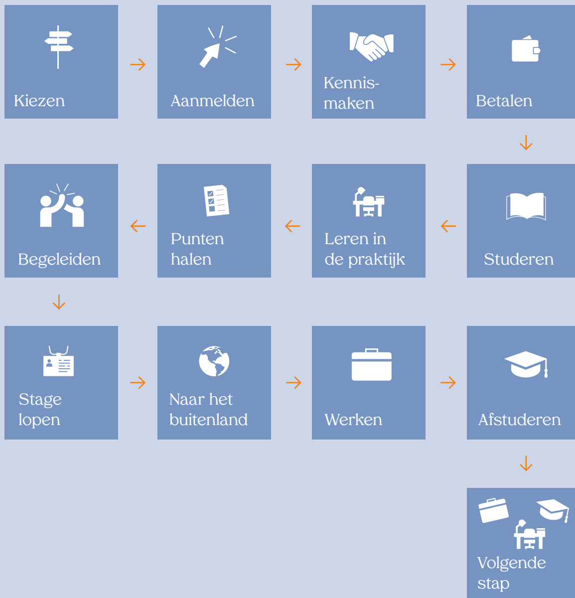
Studieproces in kaart voor studenten

De modelovereenkomst gebruikt de begeleider in gesprek met de student op cruciale momenten tijdens de studie. In onderstaande afbeelding zie je welke momenten dat zijn. Tijdens deze zogenaamde 'sleutelmomenten' ervaart iedere student, maar zeker de studerende mantelzorgers nieuwe uitdagingen en is extra kwetsbaar. Achtergrondinformatie over sleutelmomenten en de rol van de professional vind je hier . Er is ook een document 'studieproces in kaart' die de student de weg wijst langs de sleutelmomenten in het studieproces. Die vind je hier .